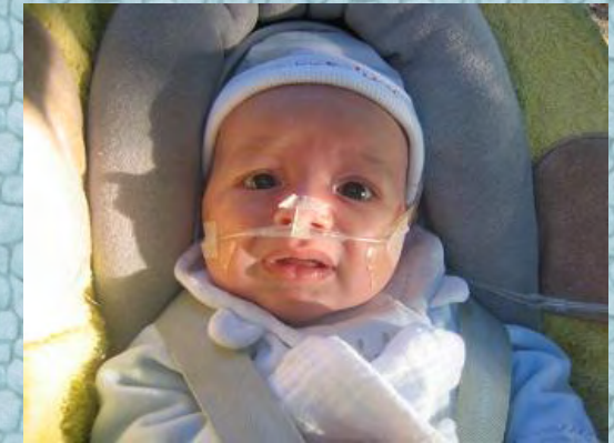
13/10/06 peur de l'appareil photo!!