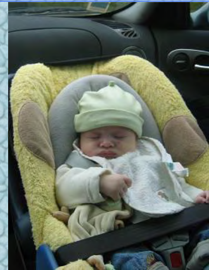
11/11/06 papa me surnomme Little boudha