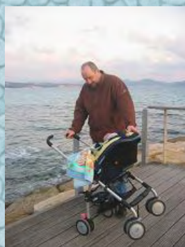
30/12/06 Papa & maman m'ont emmené voir la mer