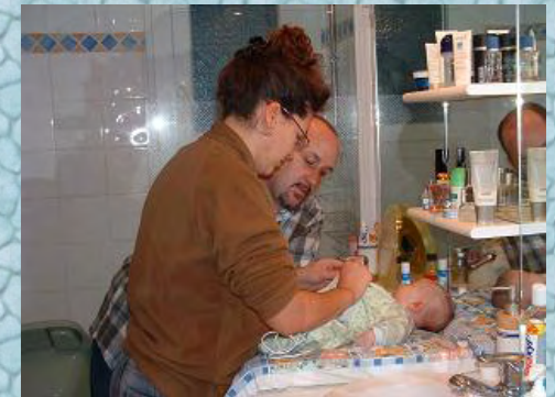
17/10/06 pas facile avec le fil d'enregistrement et le pyjama