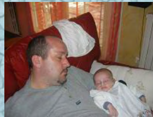
28/10/06 l'effort des guerriers