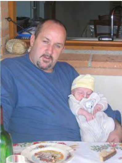
14/10/06 à Cox