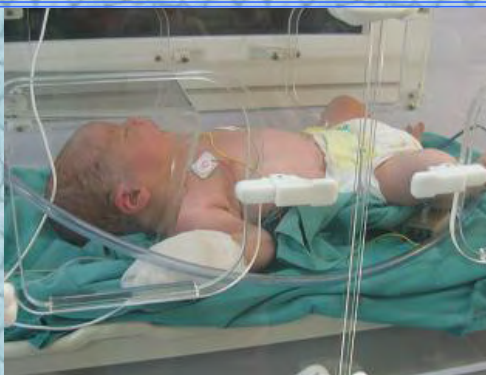
08/09/06 Clément 1h00 après