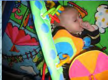
29/11/06 flagrant délit de suçage de pouce