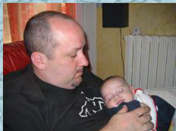
23/12/06 et puis c'est tellement confortable les bras de papa