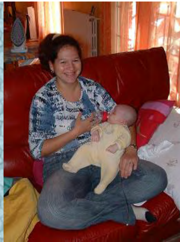
16/10/06 maman qui sourit