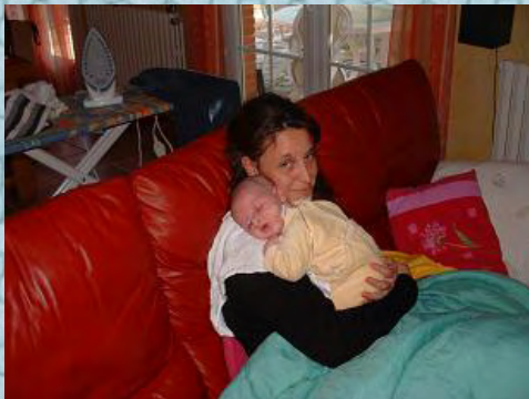
16/10/06 dans les bras de tatie thalie