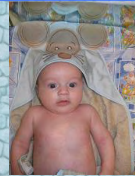
27/11/06 ma nouvelle sortie de bain