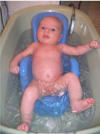
22/10/06 regardez comme j'ai grandi