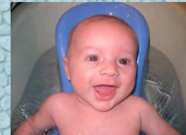
16/11/06 La baignoire devient trop petite