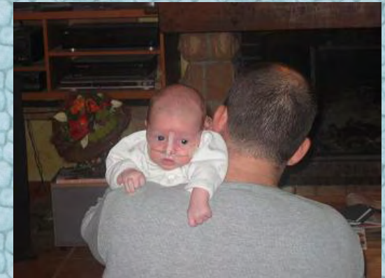
06/10/06 dans les bras de papa