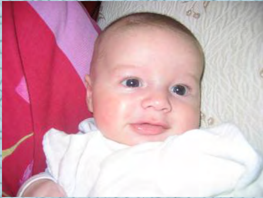
07/11/06 Le Trésor de ma vie (signé maman)