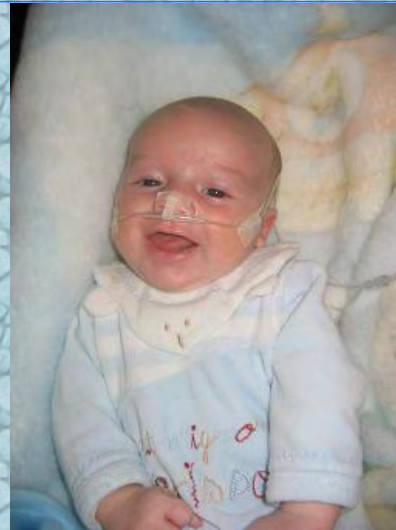
13/10/06 toujours souriant