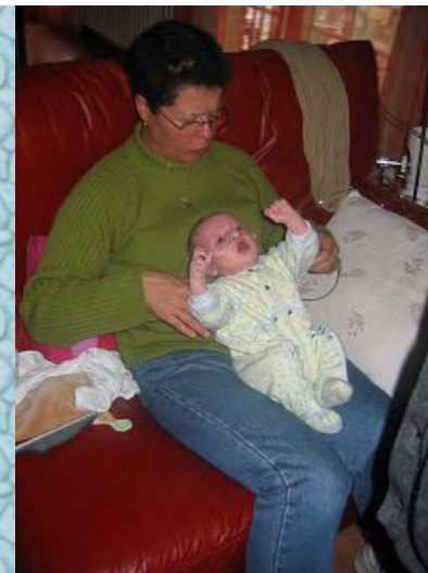
18/10/06 j'ai faim !!!!