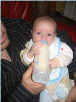
16/11/06 c'est mon bib à moi !!!