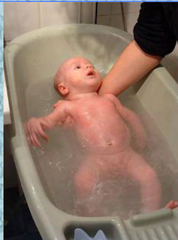
17/10/06 le bain