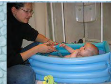
28/12/06 même pas une baignoire chez papy heureusement que maman avait prévu la p'tite baignoire gonflable