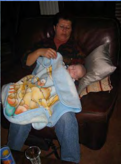
11/11/06 Dodo dans les bras de mamie (Esmes)