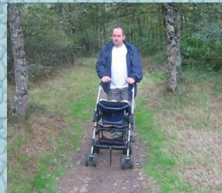
22/10/06 promenons-nous dans les bois