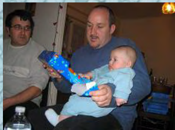
25/12/06 j'ai été gâté