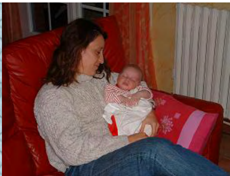
18/10/06 je les fais toutes craquer