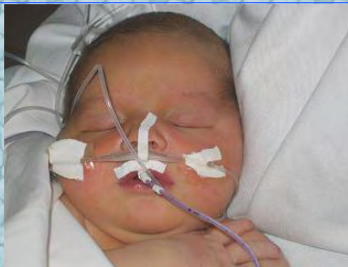
10/09/06 enfin dans les bras de maman